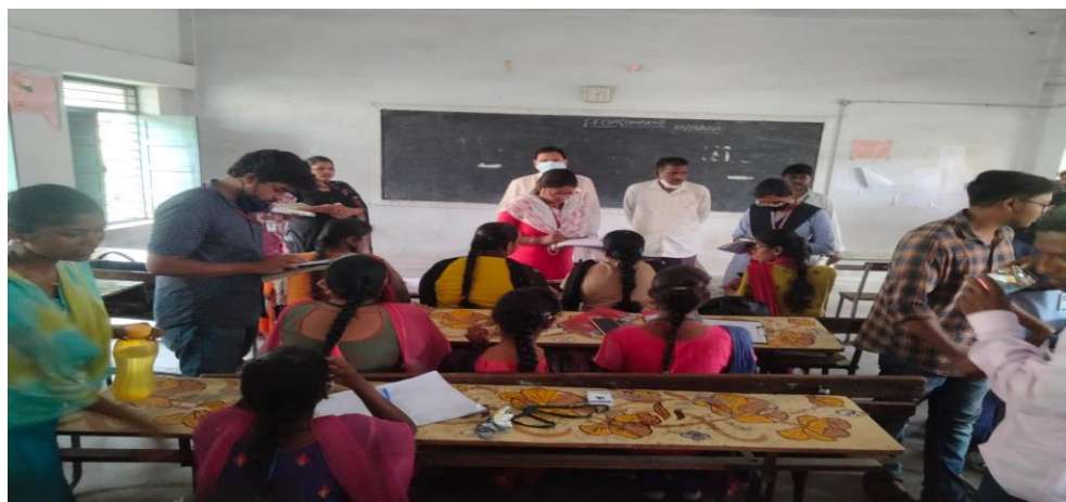
Cleanliness Survey at Montessori Mahila kalasala Vijayawada on 29 th March 2022