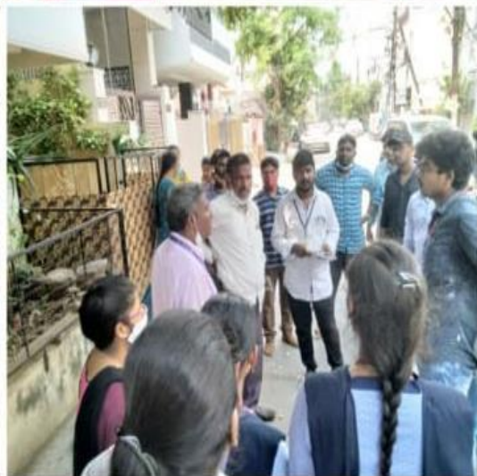
Swachh Survekshan with VMC, Vijayawada