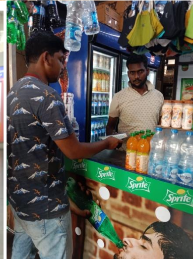
Cleanliness Survey at APSRTC Bus Station, Vijayawada on 29 th March 2022