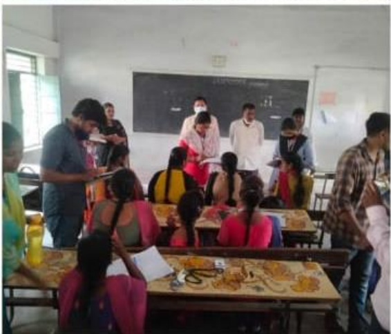
Swachh Survekshan with VMC, Vijayawada